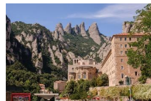
Montserrat Kloster

Der heutige Ausflug führt uns nach Montserrat zum Besuch des im 11. Jhd. gegründeten Benediktinerklosters. In der Apsis des Klosters wird die aus dem 11. Jhd. stammende schwarze Madonna aufbewahrt. Zur Mittagspause besuchen wir eine Weinkellerei mit Führung in deutscher Sprache mit Verkostung und einer Schinkenprobe. Anschließend Rückfahrt entlang der Costa Brava (Kaffeepause) zu unserem Hotel. Abendessen im Rahmen der Halbpension im Hotel.