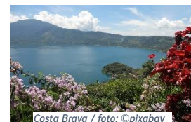
Costa Brava

Heute fahren wir nach Girona . und lernen bei einer Stadtführung die wichtigsten Sehenswürdigkeiten (Altstadt mit Kathedrale) kennen. Anschließend die Fahrt nach Figueres. Das schon von weitem erkennbare " Dali-Museum ", eine Plexiglaskuppel, die das einstige Stadttheater krönt, ist eine der bedeutendsten Sehenswürdigkeiten in ganz Katalonien. Nach einem Spaziergang in der Innenstadt fahren wir an der Costa Brava (wilde Küste) entlang zurück nach Barcelona. Die sehenswerte Landschaft mit dem von der Touristik eindeutig bevorzugtem und am besten erschlossenen Teil der Costa Brava. Abendessen im Hotel.