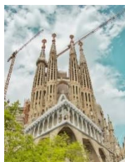
Barcelona - Gaudi Kathedrale

Nach dem Frühstück Fahrt auf der Autobahn durch das Rhonetal über Valence, Orange nach Nimes (Aufenthalt). Am Nachmittag die Anreise nach Barcelona. Es geht es über Montpellier, Perpignon, Girona zu unserem an der Costa Brava gelegenen **** Hotel Onabrava & Spa , Avinguda del Mar, 6. 08398 Santa Susanna , Telefon 0034 937 678 370, ( www.aqua-hotel.com/de/hotels/onabrava-spa/ ) hier 4 Übernachtungen mit Abendessen.